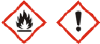
Flamme (GHS02) · Ausrufezeichen (GHS07)